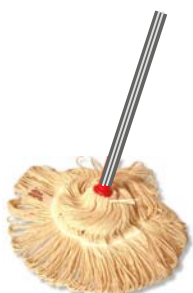
Wischarm aus Baumwolle