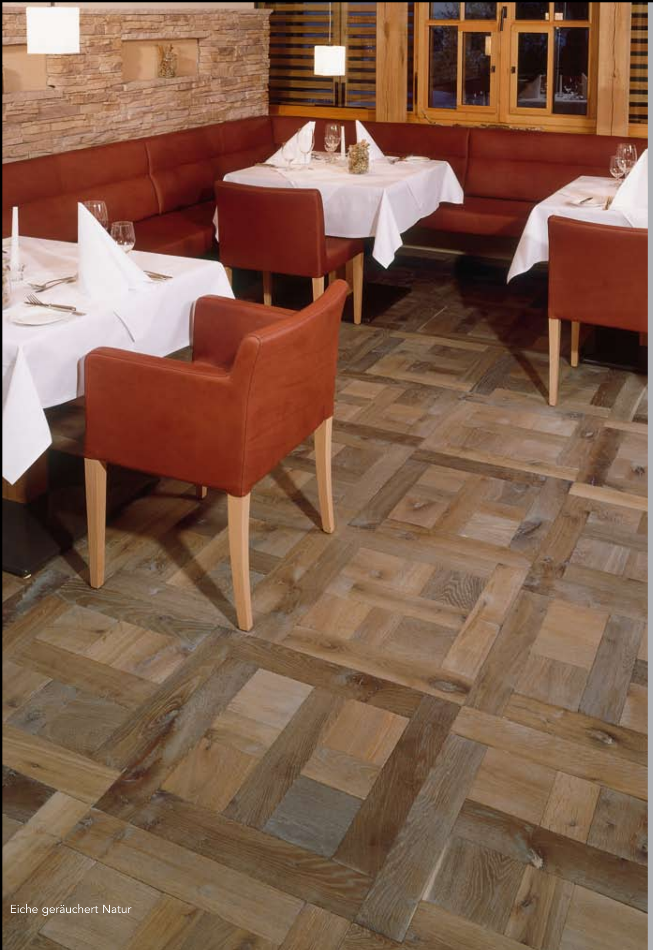
Eiche geräuchert Natur